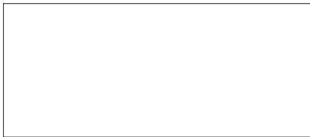
Схема границы балансовой принадлежности тепловых сетей

Прочие сведения по установлению границ раздела балансовой принадлежности тепловых сетей _____